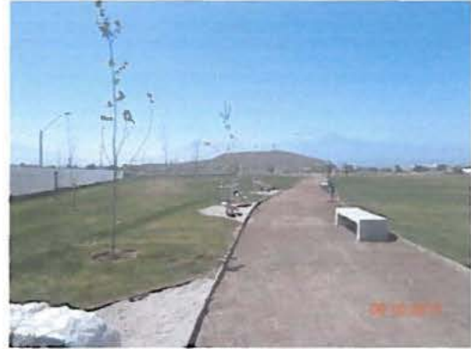
FOTOS N° 9 Y 10 ARBORIZACIÓN, CAMINOS CON MAICILLO Y CESPED ALFOMBRA